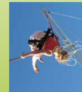
Seilgesicherte Sprünge mit dem Quarter-Tramp

Auch für das leibliche Wohl ist gesorgt: Im Greyhound Bus, im Kiosk und in der Tennis-Lounge im Stadion.